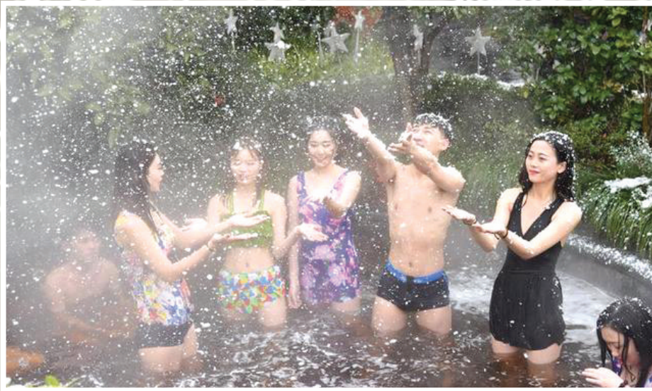
雪天泡温泉也是一种别样的享受。