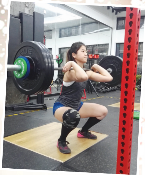
杭州某健身房,一个个健身达人们练肌肉、玩器械不亦乐乎。