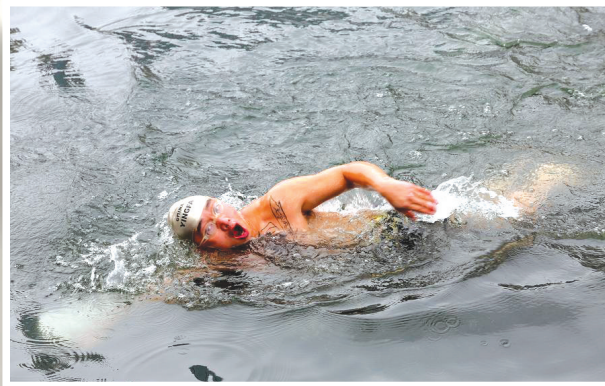
再冷也不怕,公开水域里,他们挑战着自己的极限。