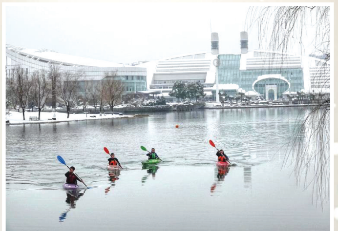
浙大校园内,小舟劈波斩浪。