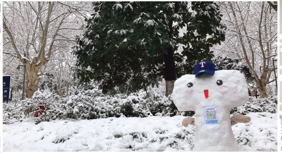
本报记者亲手堆的体坛报吉祥物“小T”气宇轩昂。