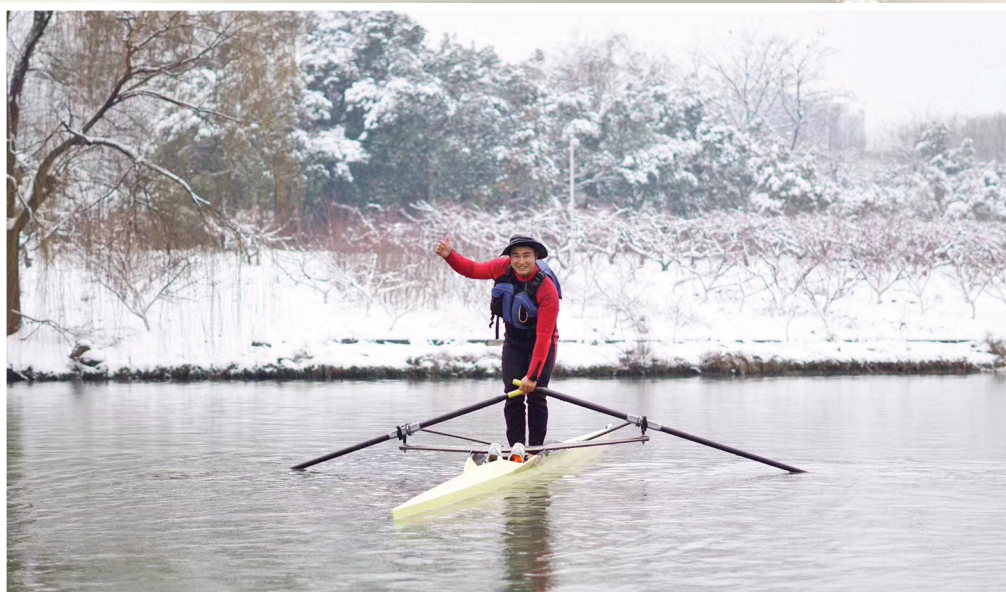
大雪过后的西溪,皮划艇划出的绝美涟漪。