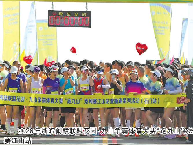
2026年浙皖闽赣联盟花园·九山争霸体育大赛“跑九山”系列赛江山站暨衢跑系列活动（石门站）