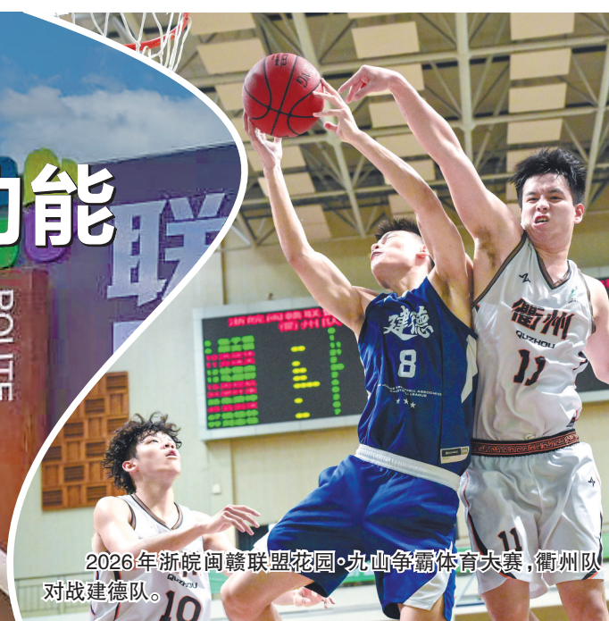
2026年浙皖闽赣联盟花园·九山争霸体育大赛，衢州队对战建德队。

6月5日晚，衢州职业技术学院体育馆内灯火通明。2026年浙皖闽赣联盟花园·九山争霸体育大赛篮球比赛迎来焦点对决，由东道主衢州队坐镇主场迎战景宁队。场馆内座无虚席，球迷助威声与篮球击地声交织回荡，全力点燃了这座千年古城的体育热情。这场赛事不仅是四省边际城市间的篮球竞技交流，更是衢州以赛为媒、探索构建区域协同发展新格局的生动实践。