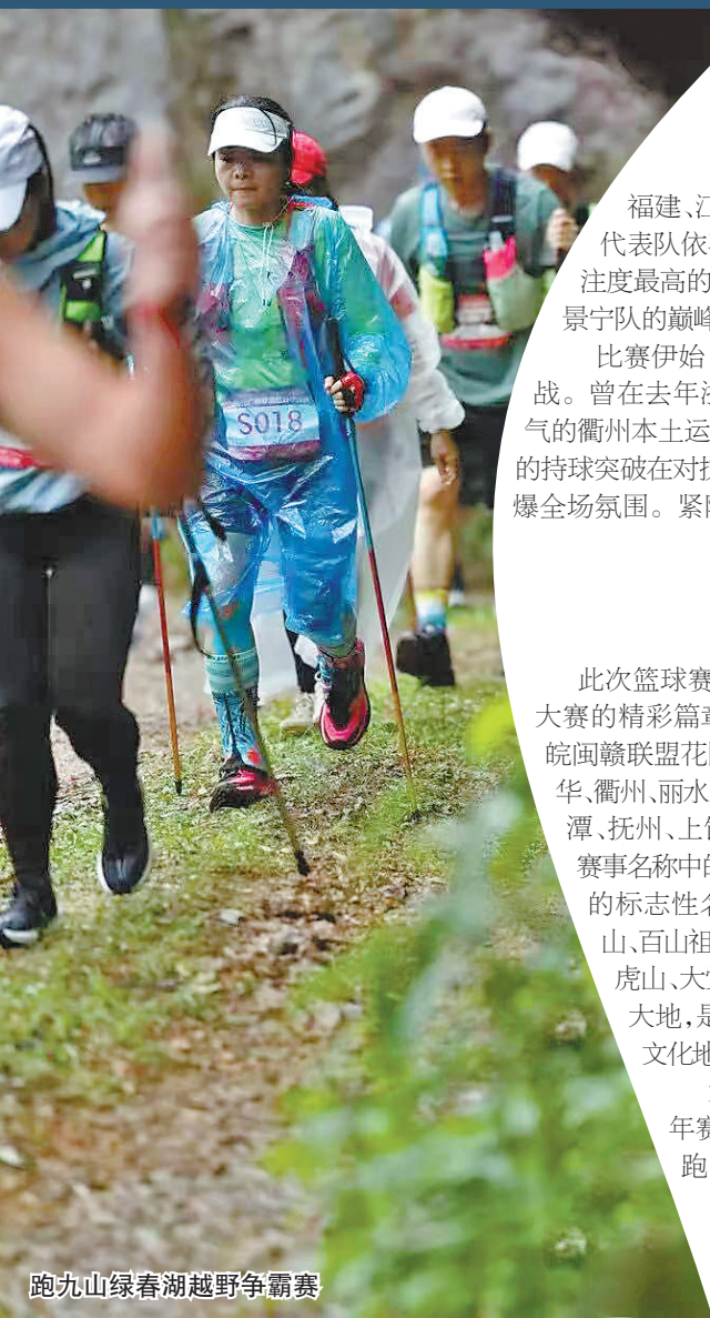
跑九山绿春湖越野争霸赛

6月5日晚，衢州职业技术学院体育馆内灯火通明。2026年浙皖闽赣联盟花园·九山争霸体育大赛篮球比赛迎来焦点对决，由东道主衢州队坐镇主场迎战景宁队。场馆内座无虚席，球迷助威声与篮球击地声交织回荡，全力点燃了这座千年古城的体育热情。这场赛事不仅是四省边际城市间的篮球竞技交流，更是衢州以赛为媒、探索构建区域协同发展新格局的生动实践。