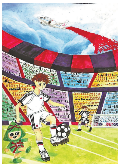
▲活力少年驰骋球场 □王唯一