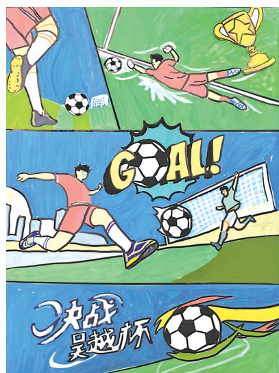
▲决战吴越杯 □闻紫涵